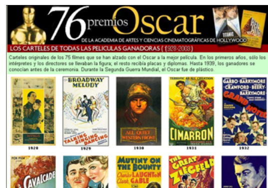
Exemples de galeries fotogràfiques

D'altra banda, s'han creat les galeries fotogràfiques que permeten potenciar la fotografia a la vegada que segueix integrada en la resta de continguts.